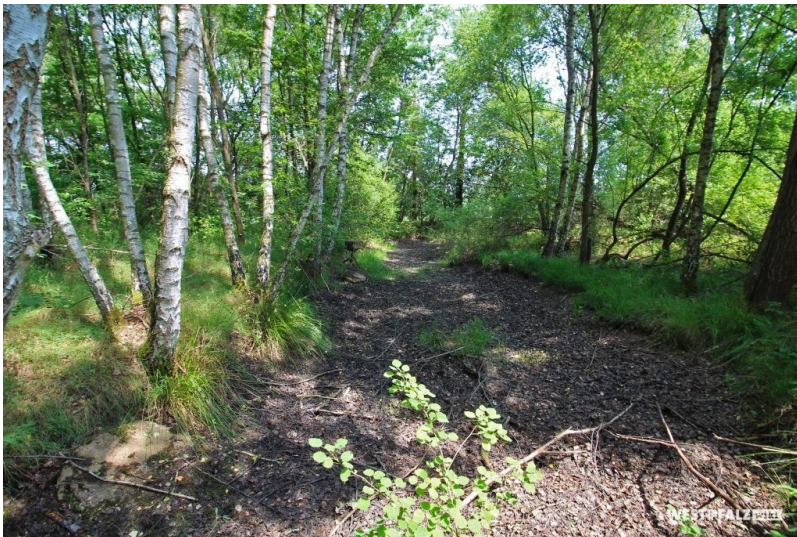
Westricher Moorniederung