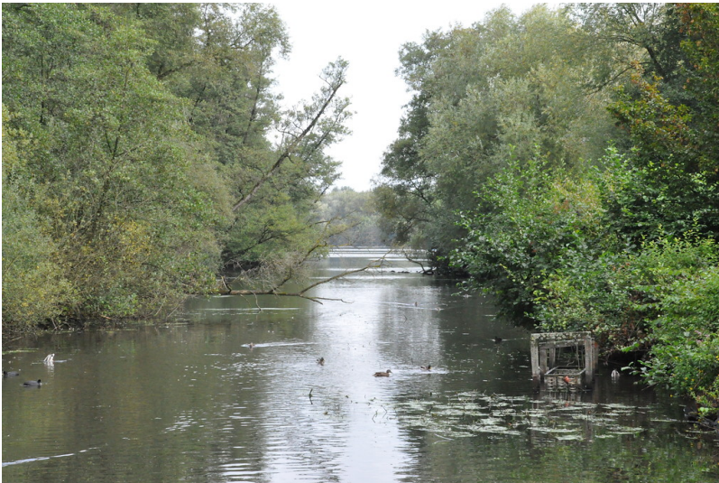
Südliches Westufer des Hariksees mit Insel (2017)