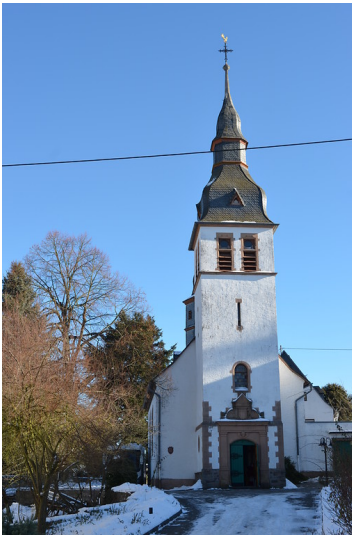
Frontansicht der evangelischen Kirche Seibersbach, Blickrichtung Osten (2017)