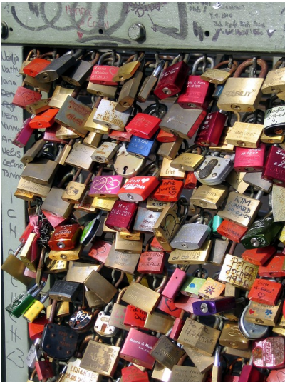
Liebesschlösser an der Hohenzollernbrücke in Köln (2012)