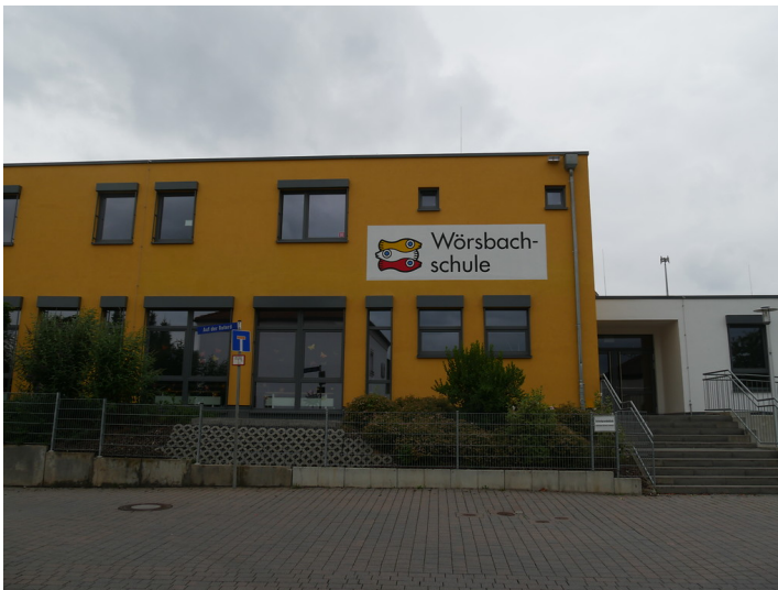
Frontansicht der Franz-Kade-Schule Wörsdorf (2017)