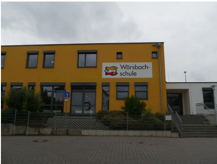
Frontansicht der Franz-Kade-Schule Wörsdorf (2017)