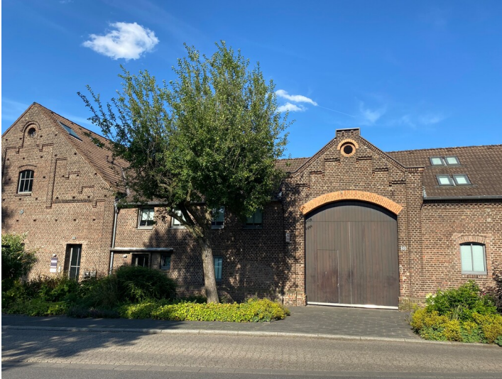
Neuer Hof in Junkersdorf (2024)