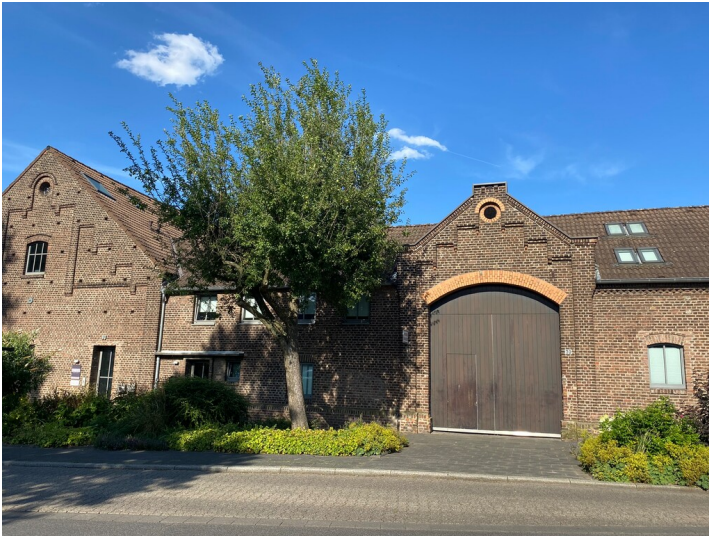
Neuer Hof in Junkersdorf (2024)