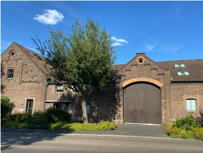
Neuer Hof in Junkersdorf (2024) Fotograf/Urheber: Carolin Ehret