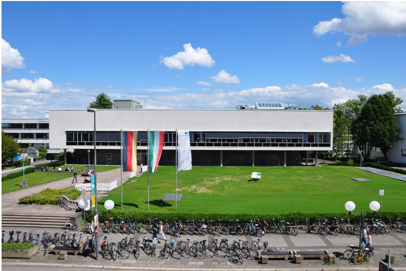
Außenansicht der Universitäts- und Landesbibliothek Bonn an der Adenauerallee (2017)