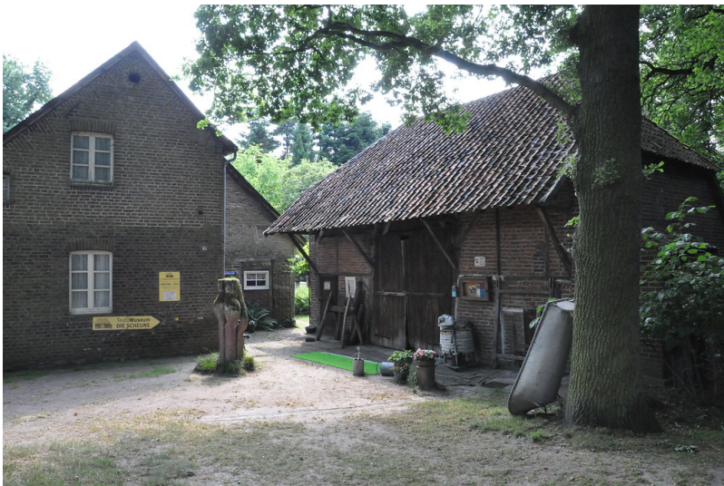
Scheune mit Ausstellungsraum (2017)