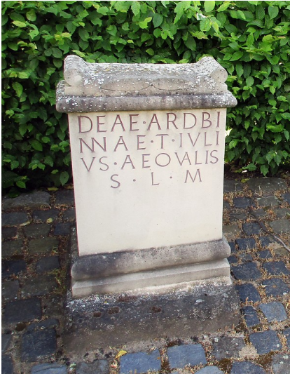
Kopie des Ardbinna-Weihestens in Hürtgenwald-Gey im Kreis Düren (2017). Das Original steht heute im LVR-Landesmuseum in Bonn.