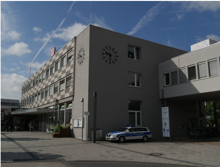
Nordansicht des Hauptgebäudes des Bahnhofs Limburg (2017)