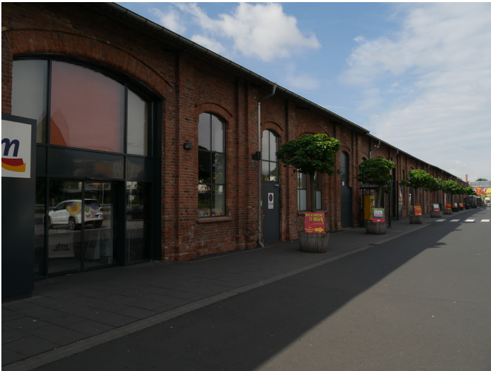
Nördliche Außenfassade der ehemaligen Richthalle des Bahnausbesserungswerkes Limburg (2017)