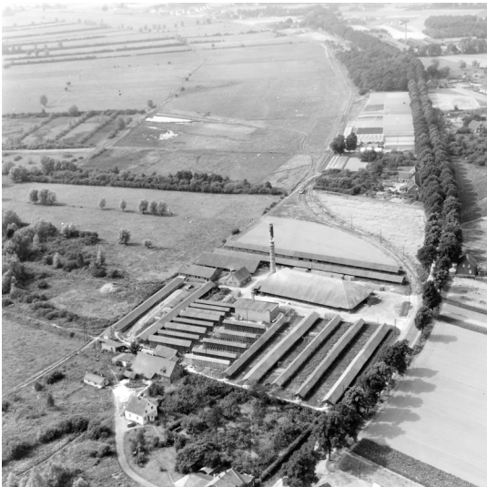
Schwarz-weiß Aufnahme einer der ehemaligen Ziegeleien, hier der Firma Block, in der Weseler Aue.