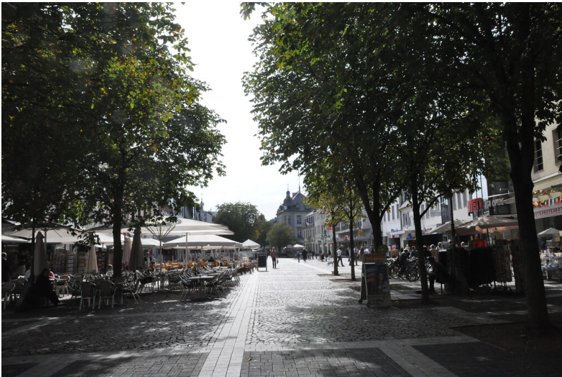
Marktplatz in Brühl (2014)