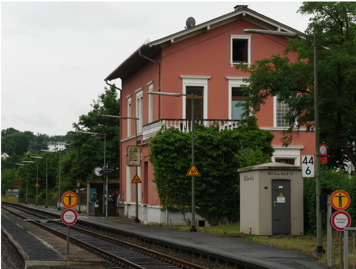
Hauptgebäude des Bahnhofs Runkel (2017)