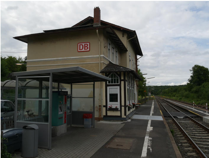
Hauptgebäude des Bahnhofs Villmar mit modernem Wartehäuschen und Ticketautomat im Vordergrund (2017)