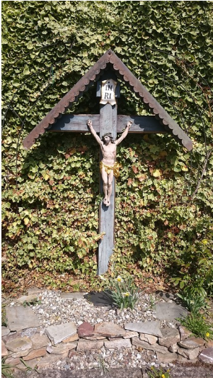
Frontansicht des Kreuzes an der katholischen Kirche in Seibersbach (2017)