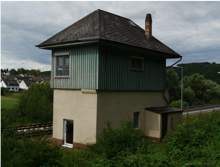
Nordwestansicht des Stellwerksgebäudes des Bahnhofs Aumenau in Villmar-Aumenau (2017)