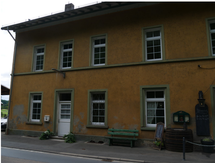
Nordseite des Hauptgebäudes des Bahnhofs Aumenau in Villmar-Aumenau (2017)