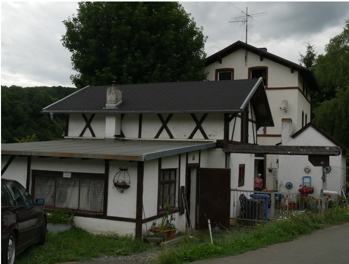
Gebäude des Bahnhofs Schafstall bei Villmar-Aumenau (2017)