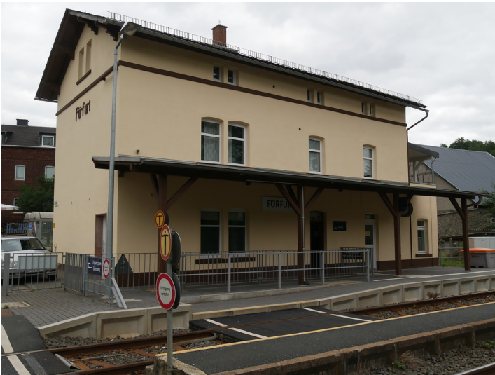
Westseite des Bahnhofsgebäudes in Weinbach-Förfurt (2017)