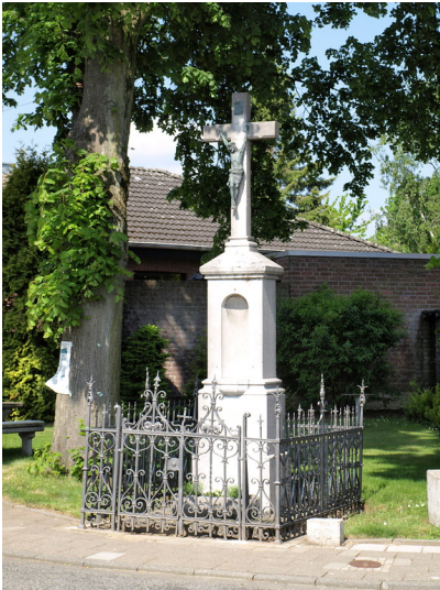
Wegekreuz am Postweg / Ecke Holzweilerstraße in Keyenberg (2010)