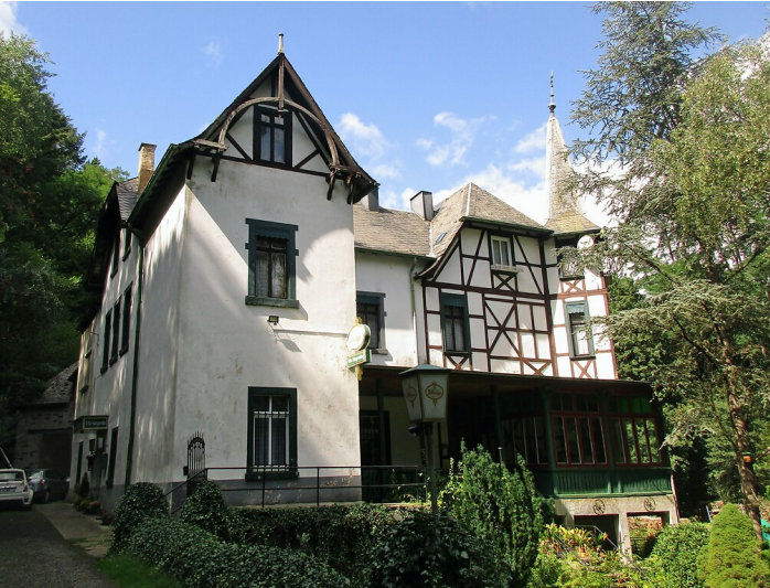
Blick auf die Villa Margarethe bzw. Margaretha im Pommerbachtal bei Wirfus (2020).