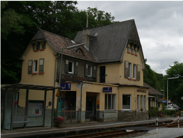
Westseite des neuen Bahnhofs in Weinbach-Gräveneck (2017)