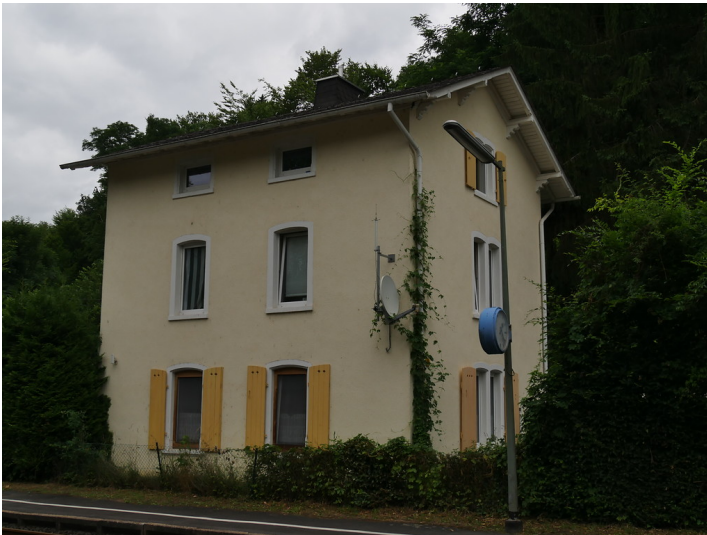
Westseite des alten Bahnhofs in Weinbach-Gräveneck (2017)