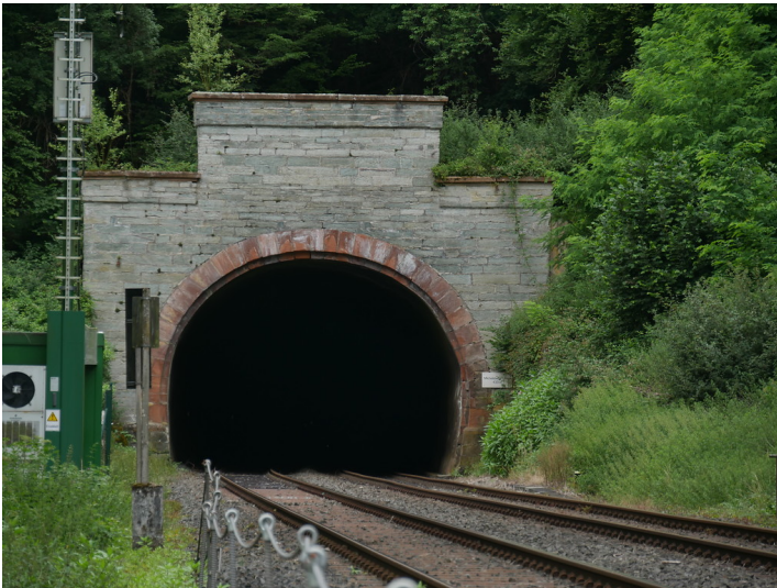
Südportal des Michelsberg-Tunnels bei Weilburg-Kirschhofen (2017)