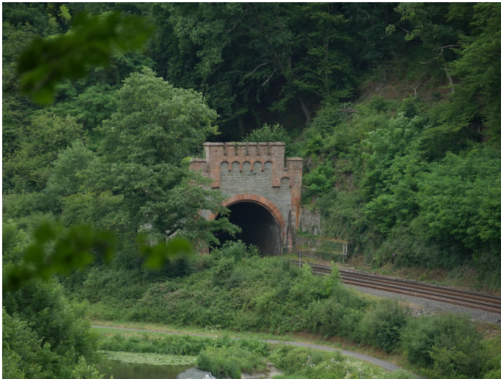
Südportal des Kirschhofener Tunnels bei Weilburg-Kirschhofen (2017)