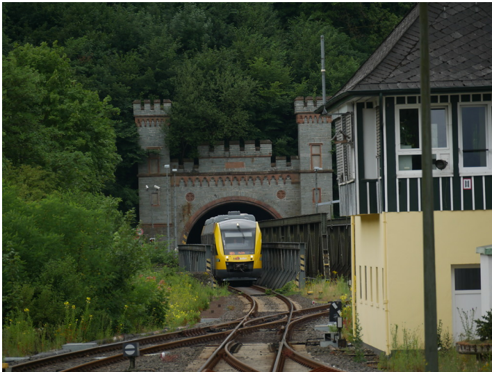
In den Bahnhof Weilburg einfahrender Zug auf der Eisenbahnbrücke nach dem Weilburger Tunnel (2017)