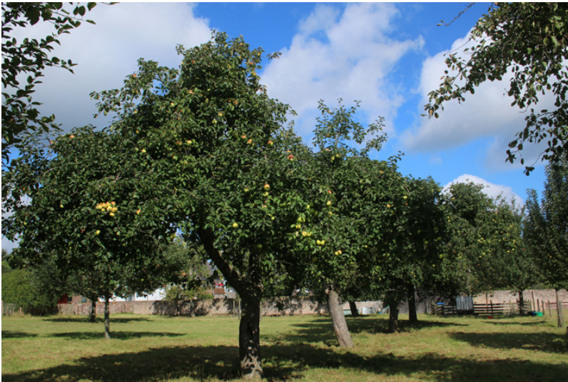
Apfelbäume im Bongert (2017)