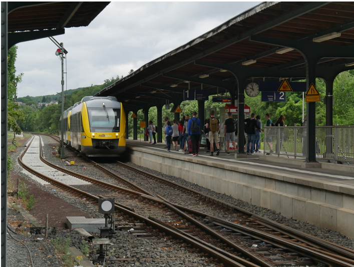
Bahnsteig des Bahnhofs Weilburg (2017)