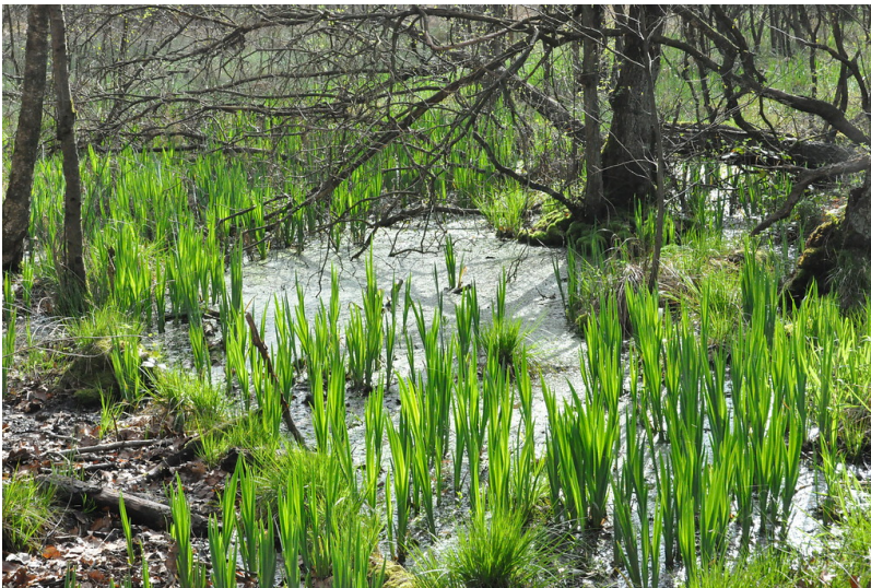
Elmpter Schwalmbruch (2017)