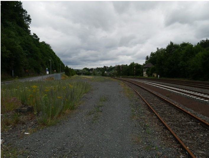
Bahnhofsgelände Weilburg. Rechts im Bild ist das Stellwerk Wo zu erkennen (2017).