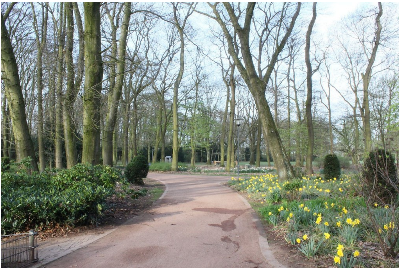
Ein Weg im Uerdinger Stadtpark