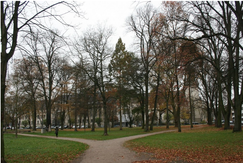
Ein Weg im Stadtgarten Krefeld (2015).