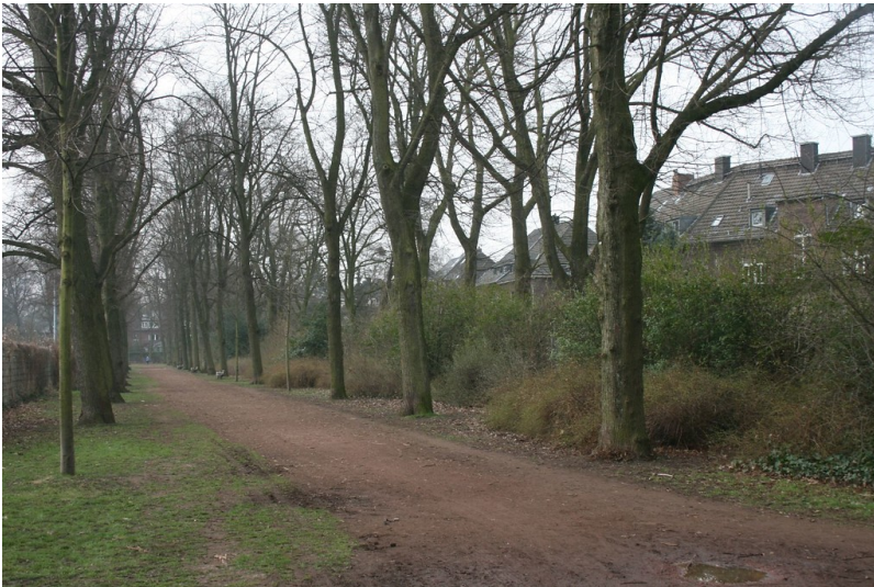
Eine Lindenallee im Kaiser Wilhelm-Park