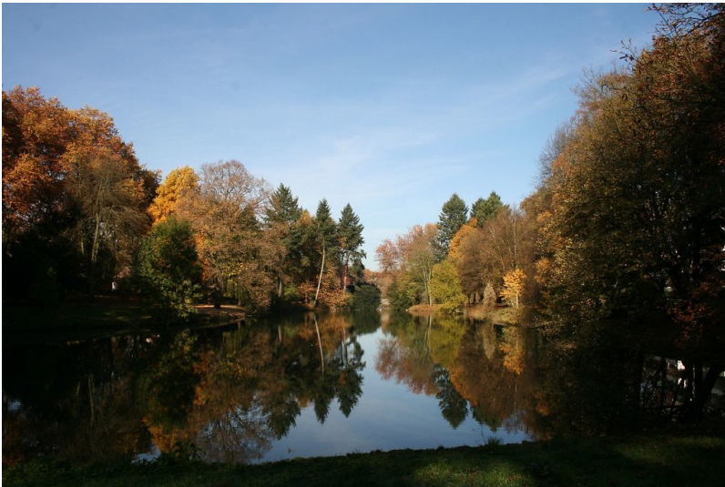
Der Weiher im Kaiserpark (2015).