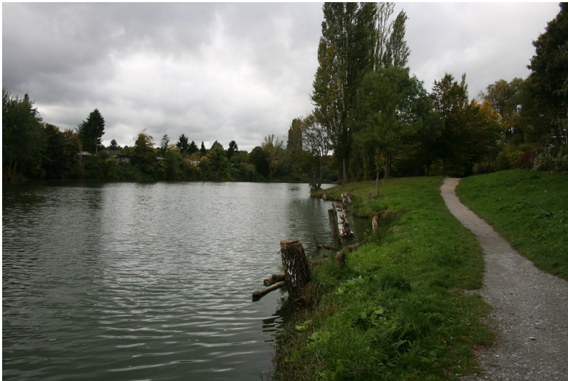
Der Fussweg an Holthausens Kull (2015).