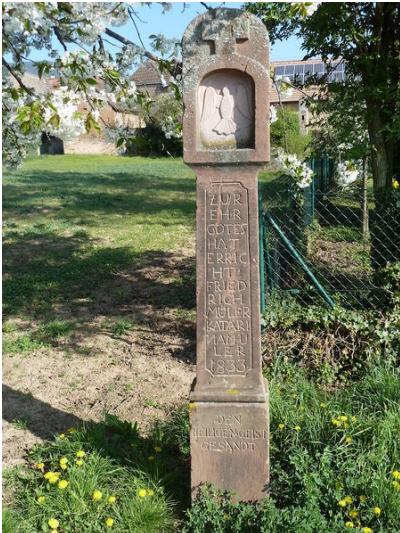
Der Bildstock Müller (1833) im Kapellenweg in Alsterweiler (Aufnahme 2017).