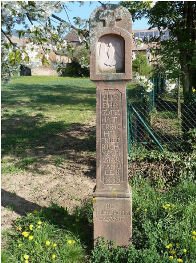
Der Bildstock Müller (1833) im Kapellenweg in Alsterweiler (Aufnahme 2017).