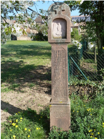
Der Bildstock Müller (1833) im Kapellenweg in Alsterweiler (Aufnahme 2017).