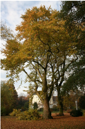
Eine alte Platane im Sollbrüggen Park (2015).