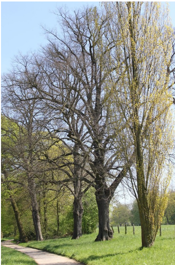
Lindenreihe im Greiffenhorst-Park (2016).