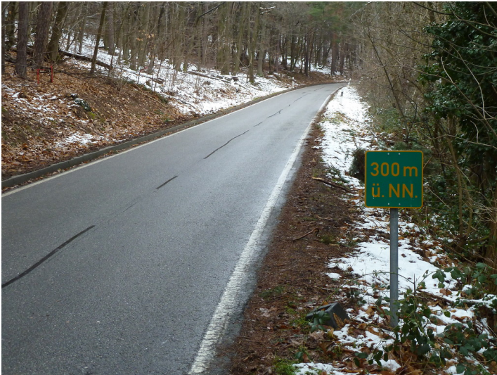
Die Kalmitstraße bei Höhenmeter 300 ü.NN im Winter im Jahre 2015.