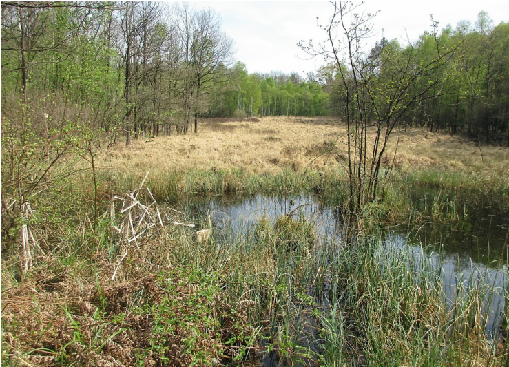
Teichlandschaft Lohmarer Wald zwischen Lohmar und Siegburg: Das Areal nordwestlich des alten Fortshauses Rothenbacher Hof (2017).