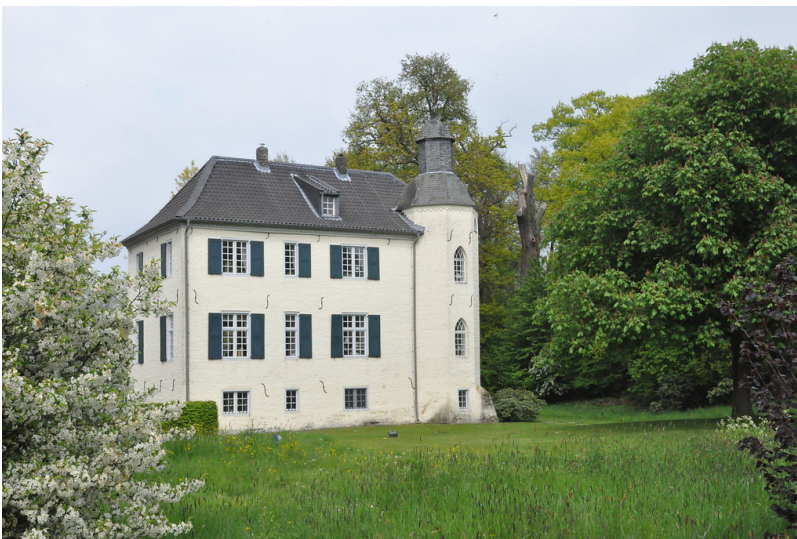
Haus Bey mit Turm (2017)