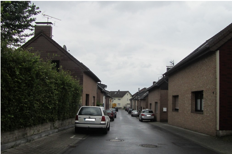
Kolonie Ginsterhang (2014)