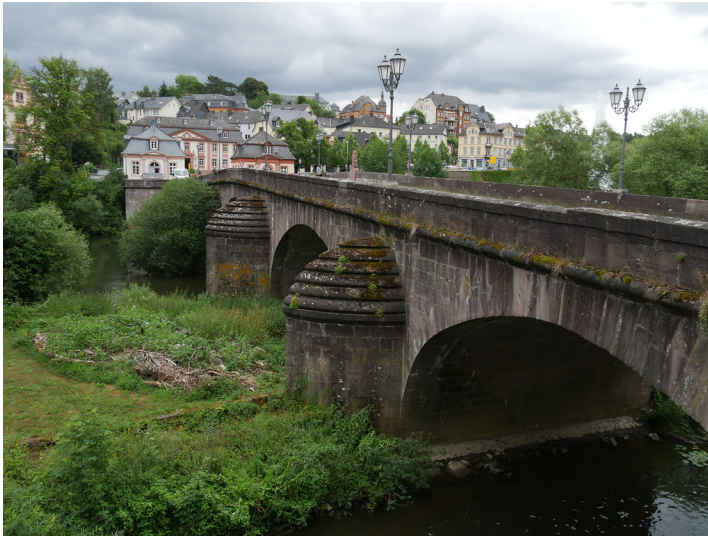
Steinerne Brücke in Weilburg mit Pavillons im Hintergrund (2017)