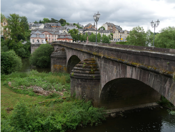
Steinerne Brücke in Weilburg mit Pavillons im Hintergrund (2017)