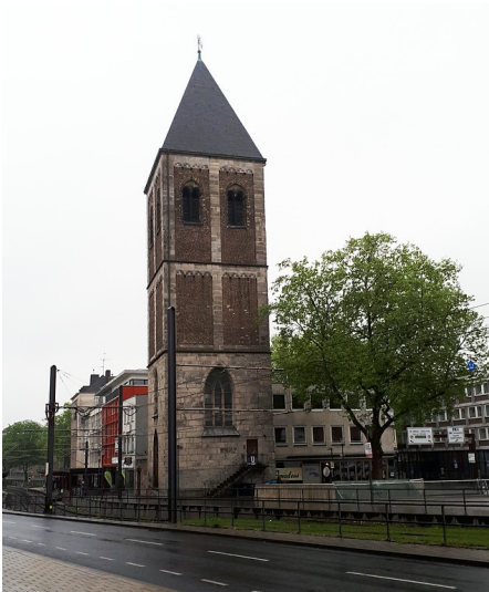
Der verbliebene Turm der früheren Pfarrkirche Klein Sankt Martin in Köln-Altstadt-Süd (2017)