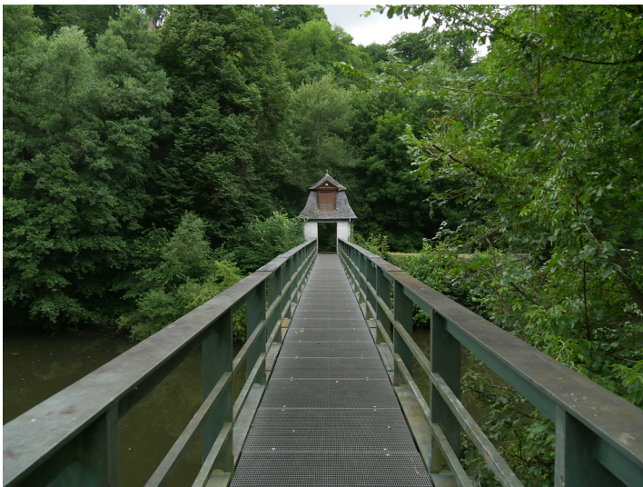
Ernst-Dienstbach-Steg in Weilburg, Blickrichtung Westen (2017)