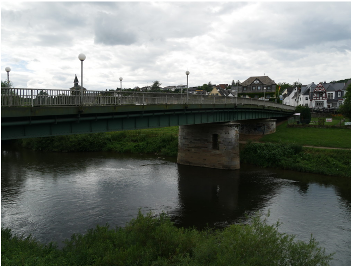
Straßenbrücke in Villmar-Aumenau, Blick von der linken Lahnseite Richtung Nordwesten (2017)